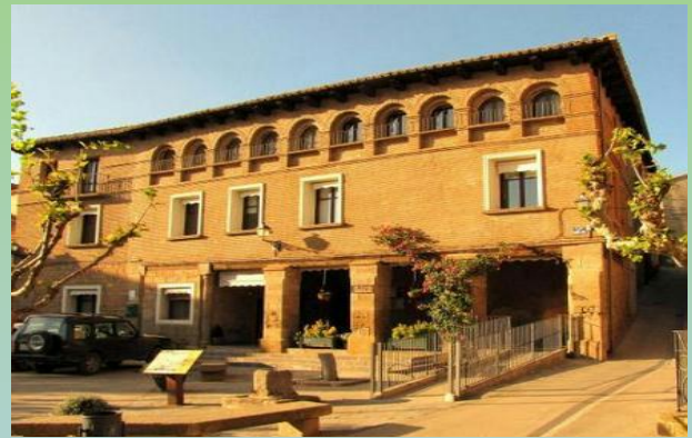
Hospederia de Loarre