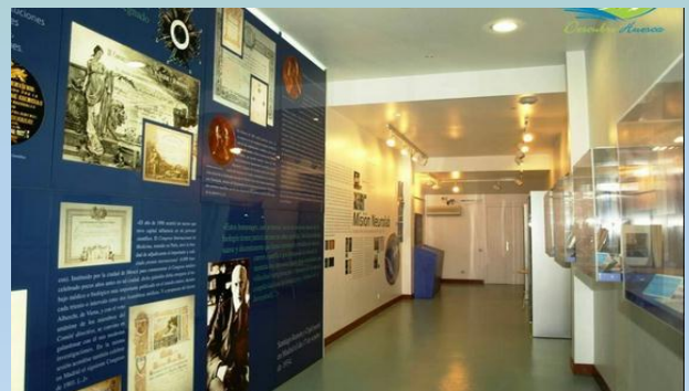
Centro Interpr. Ramón y Cajal