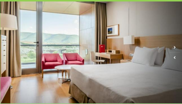
Hotel Exe Las Margas.