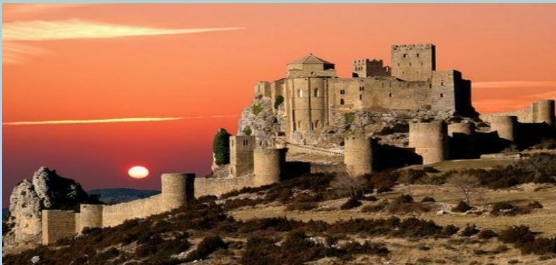
Castillo de Loarre