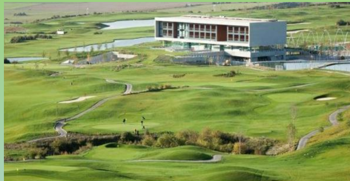
Hotel y Golf Las Margas